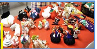
すてきな手芸作品